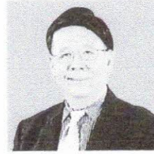
รศ.ดร.สมภพ มานะรังสรรค์ อธิการบดี PIM