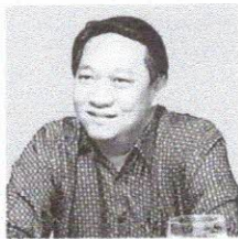
คุณก่อศักดิ์ ไชยรัศมีศักดิ์ ประธานกรรมการบริหาร บริษัท ซีพี ออลล์ จำกัด (มหาชน)